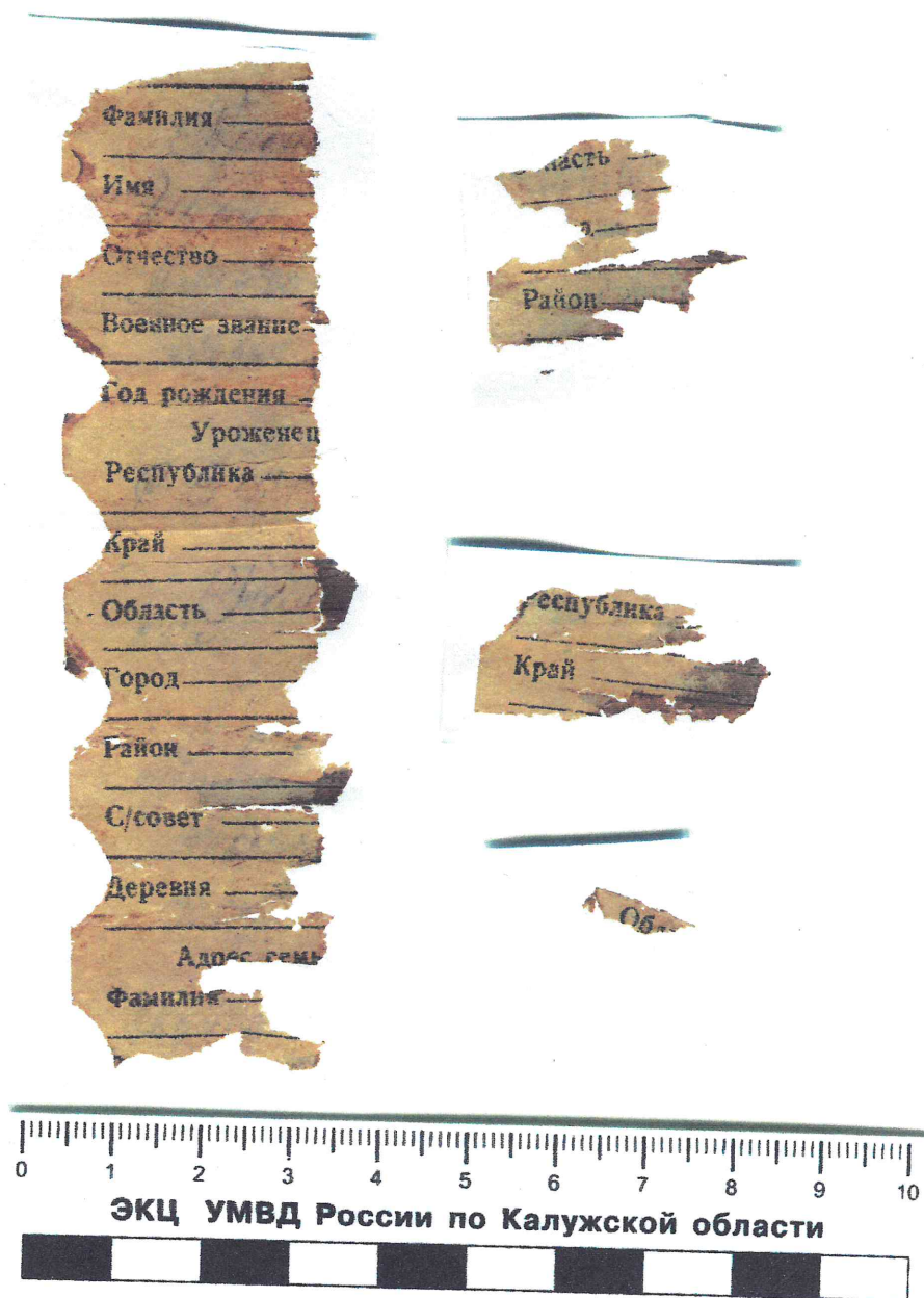
Иллюстрация 1. Вкладыш солдатского медальона, обнаруженный в ходе в ходе поисковых работ в д. Щербинино Мосальского района Калужской области 19.05.2024.